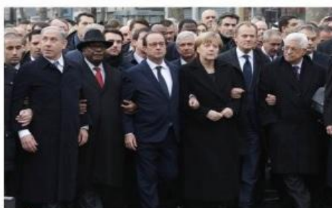
PARIS El presidente francés, Francois Hollande, y los líderes de Alemania, Italia, Israel, Turquía, Gran Bretaña y los Territorios Palestinos, entre otros, avanzaron desde la Place de la Republique delante de un mar de banderas francesas y de otros países, en medio de intensas medidas de seguridad en la ciudad.

Decenas de líderes mundiales, entre ellos el primer ministro de Israel y jefes de Estado musulmanes, marcharon el domingo en París tomados de los brazos y se sumaron a más de un millón de personas que se manifestaron bajo fuertes medidas de seguridad en un tributo sin precedentes a las víctimas de los ataques.