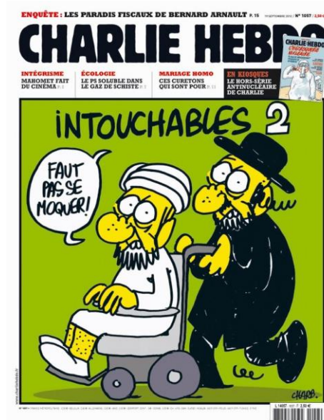
Portadas de la revista Charlie Hebdo del 09/11/2011 y el 19/09/2012