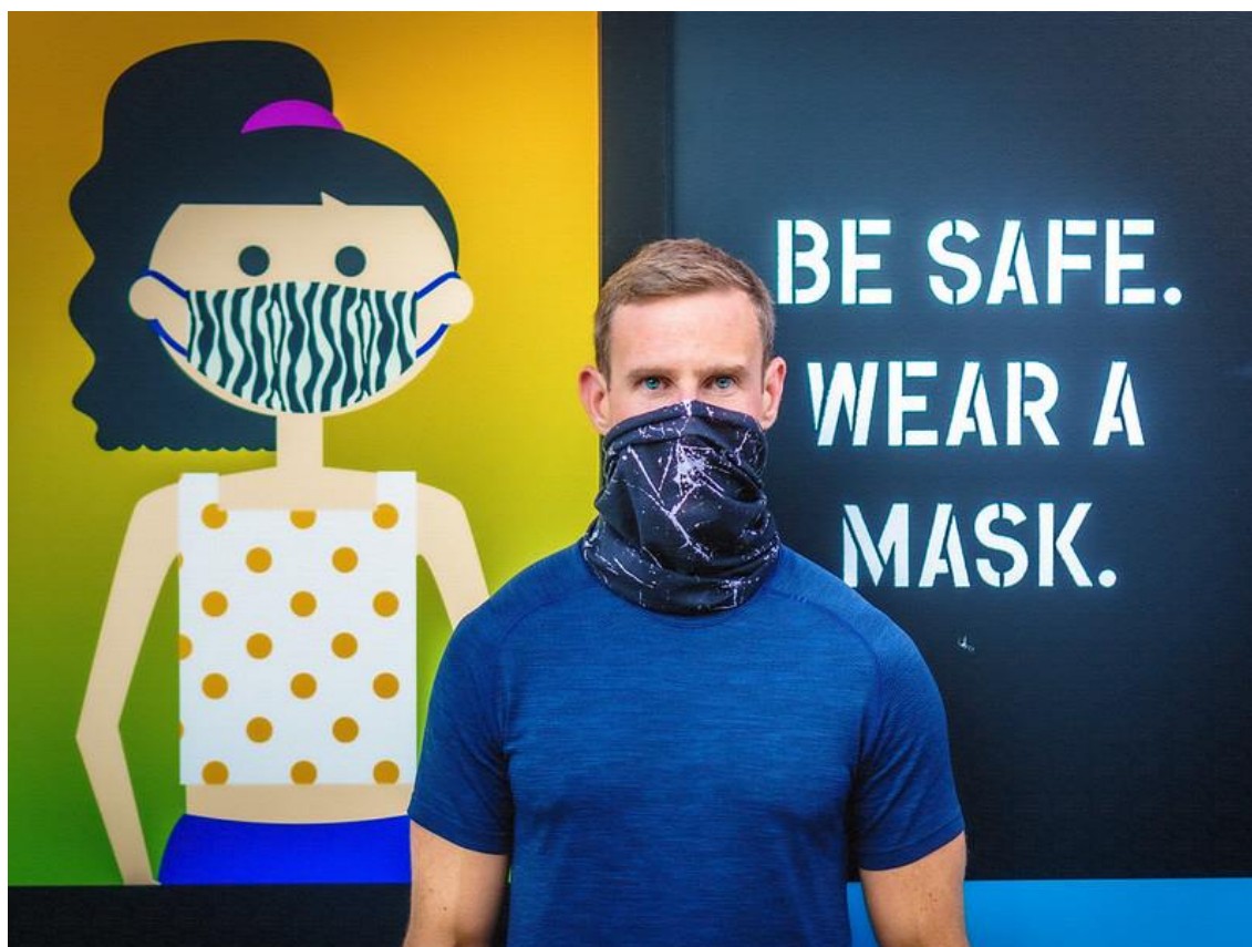
Figura 5. DC People and places con la leyenda “Cuidate. Usa un cubrebocas.

Hall (1997) proponía que los medios de comunicación producen mensajes de dominación de roles de género, clases sociales y estereotipos negativos de gente de raza negra. Además, producen contramensajes de resistencia que refutan la subordinación de los grupos marginados. Es decir, donde hay opresión, hay resistencia. En internet