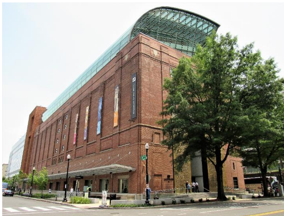
Figura 2. Museum of the Bible, Washington D.C. Autor. Farragutful. Extraída de: https://commons.wikimedia.org/wiki/File:Museum_of_the_Bible_02.jpg

Se observa que la base electoral de estos sectores religiosos y políticos construye su propia realidad basada en una junk science “falsa ciencia”. Los procesos científicos de rigor metodológico no operan dentro de los mismos tiempos de la sociedad consumidora. Necesitan mucho tiempo para ofrecer resultados y aportes concretos a la sociedad. Se puede aseverar que las descalificaciones de los científicos de Trump son un producto de este largo proceso de disenso entre comunidades académicas-científicas, población en general y otros sectores religiosos que cobran influencia en las esferas políticas de Washington.