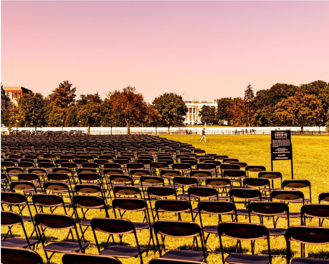
Figura 6. Memorial Nacional por la Covid-19.

En la imagen 6 se puede observar un memorial en Washington, DC con centenas de sillas vacías cuyo objetivo es el no-olvido y la memoria, apelando de manera simbólica a la remembranza de los cientos de miles de personas que han perecido por esta enfermedad en Estados Unidos.