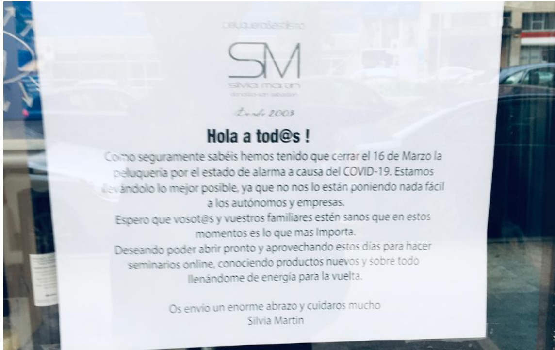
Figura 1. Cartel desplegado en el aparador de una peluquería.

externos, principalmente a cuatro: 1) el virus SARS-CoV-2; 2) el gobierno; 3) las autoridades de salud, o 4) la contingencia/crisis sanitaria (en forma de un agente hiperbolizado). Entonces, el tipo de atribución agentiva que ocurre en este caso tiene que ver con la cuestión de encontrar un culpable a quien imputar por la situación actual.