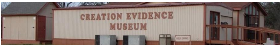
Figura 1. Creation Evidence Museum. Autor Ian Juby. Extraída de: https://commons.wikimedia.org/wiki/File:WV_banner_Cross_Timber_Creation_Evidence_Museum_in_Glen_Rose.jpg .

La expresión más destacada del movimiento creacionista es el Museum of the Bible 14 ubicado eficazmente a dos cuadras del museo Smithsonian y cerca de la explanada central del capitolio en Washington D.C (imagen 4). Por su parte, Trump asistió a la apertura del museo en 2017 como una clara señal a su base de su afinidad por esta ideología religiosa-creacionista.