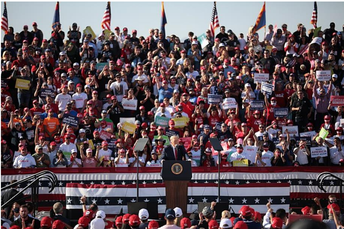
Figura 3. Imagen 3. Donald Trump con sus seguidores.

Para finalizar se incluyen algunas fotografías que proyectan la ideología de la base social de Trump que, por lo general, en adición a su apego por las teorías de la conspiración, se reconocen en su resistencia a las políticas de salud.