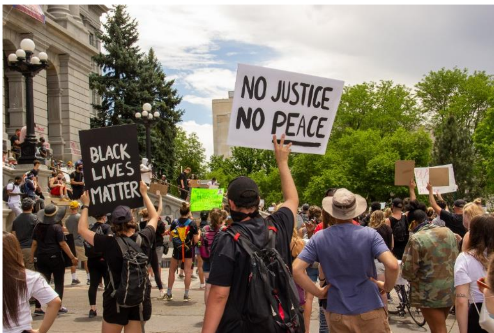
Figura 4. Imagen 4. Protesta por George Floyd en Denver, Colorado.

La imagen 4 se tomó durante las protestas contra el racismo de Trump del movimiento social llamado Black lives matter . En él se veía un performance o lenguaje (Diamond, 1996) del fascismo que incluía una ideología correspondiente. En el contexto de la misma pandemia, y el efecto desigual de la enfermedad en las comunidades de color, la muerte de George Floyd, el 25 de mayo del 2020, exacerbó la desesperación del racismo estructural del país. En esta situación, la administración de Trump optó por la represión militarizada (revisar la liga de la nota al final del artículo para mayor referencia). 20