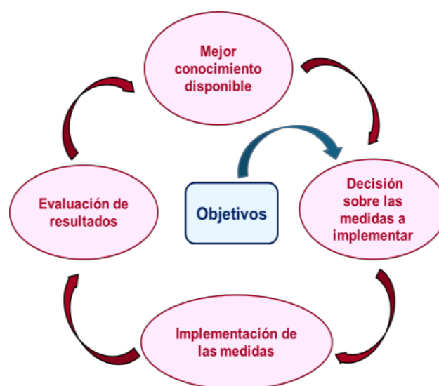
Figura 2. Gestión cíclica adaptativa.

Dado que la incertidumbre es un componente normal en el ámbito de los sistemas socioecológicos reales, el conocimiento debe utilizarse dentro de un ciclo adaptativo (Halbe et al. 2020). La figura 2 esquematiza este ciclo, en el cual se establecen determinados objetivos y sobre la base del conocimiento disponible se definen y aplican las medidas necesarias. La evaluación de los resultados obtenidos permite determinar si tales medidas han sido eficaces o es necesario cambiarlas. Finalmente, dicha evaluación realimenta el conocimiento disponible, facilitando un avance en espiral. Este ciclo de gestión adaptativa es la base conceptual del ciclo de planificación requerido, por ejemplo, por la Directiva Marco del Agua.