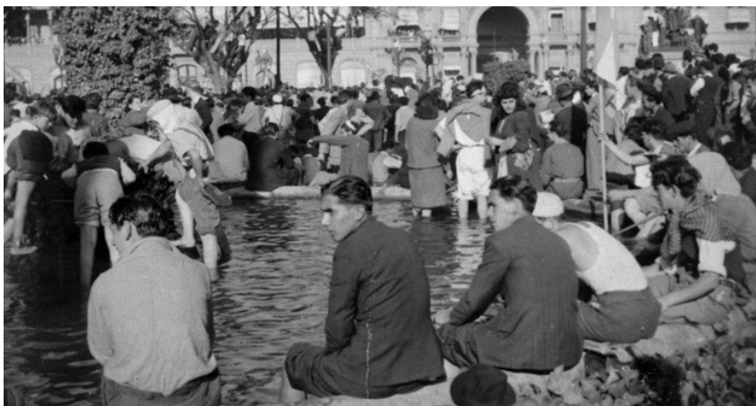
Imagen “Las patas en la fuente”. Autoría anónima. Conservada en el Archivo General de la Nación, Argentina. Dominio público.

La historia latinoamericana ha manifestado cómo durante los procesos políticos populistas el pueblo se ha transformado de una colectividad de clientes, consumidores y súbditos (Vilas, 2004), a una comunidad política de actores, multitudes y ciudadanos que en potencia y en acto han reclamado para sí su reconocimiento como sujetos políticos. Basta recordar la imagen épica del escenario argentino allá por los años cuarenta, en medio del auge del peronismo, en que un grupo de trabajadores de las nacientes industrias se refrescaban en una fuente de agua en la Plaza de Mayo, espacio vedado para la plebe, como gesto de rebeldía y hartazgo frente a décadas de sumisión y explotación.